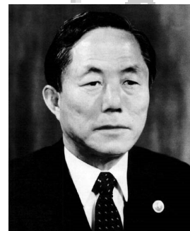
Gen. Choi Hong Hi