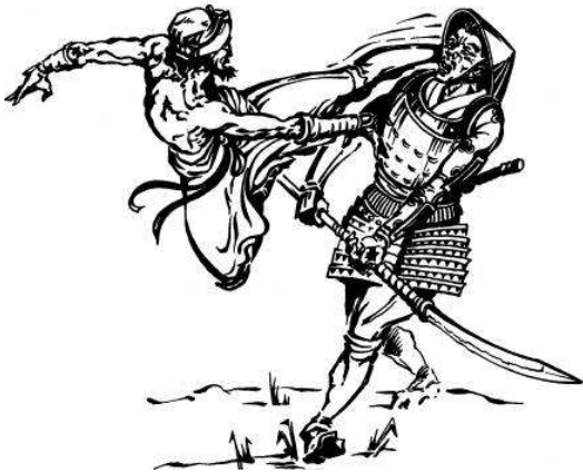
Abb. 3 Kampf eines Okinawaners gegen einen

Das ‚Waffenverbot‘ wurde erneuert und weitere Freiheitseinschränkungen wurden eingeführt. So standen die Okinawaner ganz unter der Führung der Japaner.