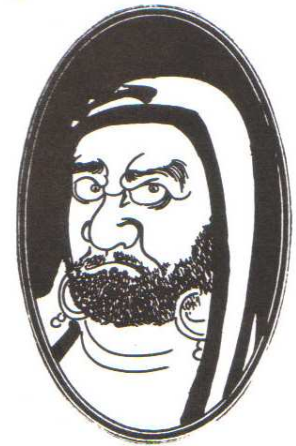
Abb. 1 Bodhidharma, der vermutliche Gründer der Shaolin-Kung-Fu Techniken

Karate entstand aus dem Shaolin Kung-Fu 1 , das beim Shaolinkloster in Dengen 2 praktiziert wurde. Dieses Shaolinkloster war das Pilgerziel des indischen Mönchs Bodhidharma 3 . Seine Aufgabe war, die Schüler im Zen- Buddhismus und in den gymnastischen Kampfübungen zu unterrichten. Er beobachtete die Verhaltensweise der Tiere, wodurch sich Techniken von den Tierstellungen und Tierbewegungen ableiteten. Es wird gesagt, dass er der Gründer des Shaolin Kung-Fu sei.