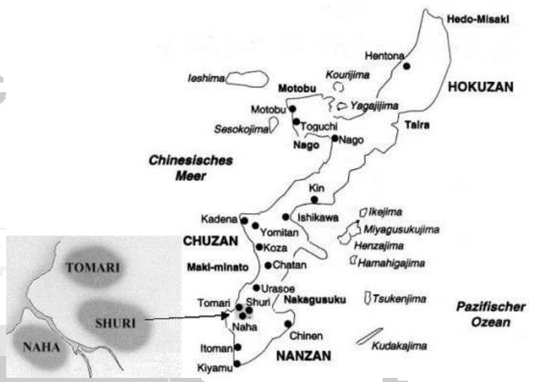
Abb. 2 Landkarte von Okinawa, mit den drei wichtigen Städten Tomari, Shuri und Naha

Die Insel Okinawa war bereits vor vielen Jahren in Kontakt mit dem Festland. Die ersten Kontakte waren diejenigen mit China in der Zeit der Sui-Dynastie 6 . Durch den chinesischen Kaiser Yang Chien gelangen die Chinesen nach Okinawa. Bis ins 7. Jahrhundert war Japan politisch abhängig von China. Durch die neuen Wege, die Japan somit eingehen konnte, entstand im 7. und 8. Jahrhundert reger Reiseverkehr zwischen Japan und Okinawa.