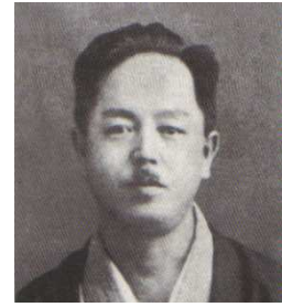
Abb. Foto vom Stilgründer des Shito- Ryu, Kenwa Mabuni

Der Stilgründer des Shito-Ryu war der Okinawaner Kenwa Mabuni (1889-1952). Er war sowohl Schüler des in der Region Shuri lebenden Grossmeisters Itosu, als auch des Grossmeisters Higashionna. Mabuni praktizierte nicht nur die Kampfkunst der "leeren Hände", sondern war auch ein Meister im Umgang mit den traditionellen, okinawanischen Waffen (Kobudo). Die Bezeichnung Shito leitet sich von den Namen dieser beiden okinawanischen Grossmeistern ab (Shi - Higaonna, To – Itosu; entspricht jeweils einer alternativen Aussprache der ersten Silbe). Aus diesen beiden Silben entstand der Stilname. Die erste Schule des Shito-Ryu (Yoshukan) gründete Mabuni in Osaka (Japan). Noch heute ist Osaka die Hochburg des Shito-Ryu Karate.